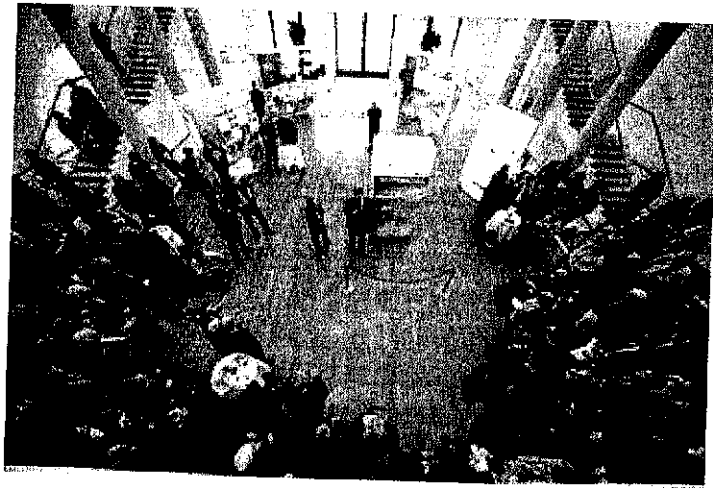
Die Freiburger Klimakonferenz stößt auf reges Interesse.

Die Resonanz war riesig: Mehr als 1300 Menschen hatten sich für die Tagung "Sicherheitsbedrohung Klimawandel – Handlungsoptionen für Politik, Wissenschaft und Wirtschaft" im Freiburger Konzerthaus angemeldet. Natürlich auch, weil hoher Besuch angesagt war: Außenminister Frank-Walter Steinmeier (SPD) und der Vorsitzende des Weltklimarats, Rajendra Pachauri. Organisiert hatte die Konferenz Gernot Eler (SPD), Staatssekretär im Auswärtigen Amt, der auch gleich zu Beginn versprach, dass die gewonnenen Erkenntnisse in die Politik der Bundesregierung einfließen werden.